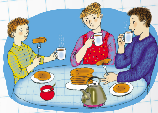
Рис. художника Ксении Почтенной

Воскресенье – вот везенье! Воскресенья так нужны, Потому что в воскресенье Мама делает блины, Папа чашки к чаю моет, Вытираем их вдвоем, А потом мы всей семьей Чай с блинами долго пьем. А в окошко льется песня, Я и сам запеть готов, Хорошо, когда мы вместе, Даже если нет блинов!